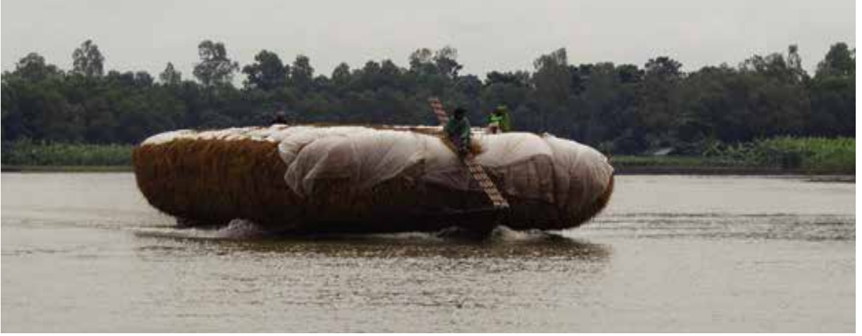
পুংলি নদী, টাঙ্গাইল