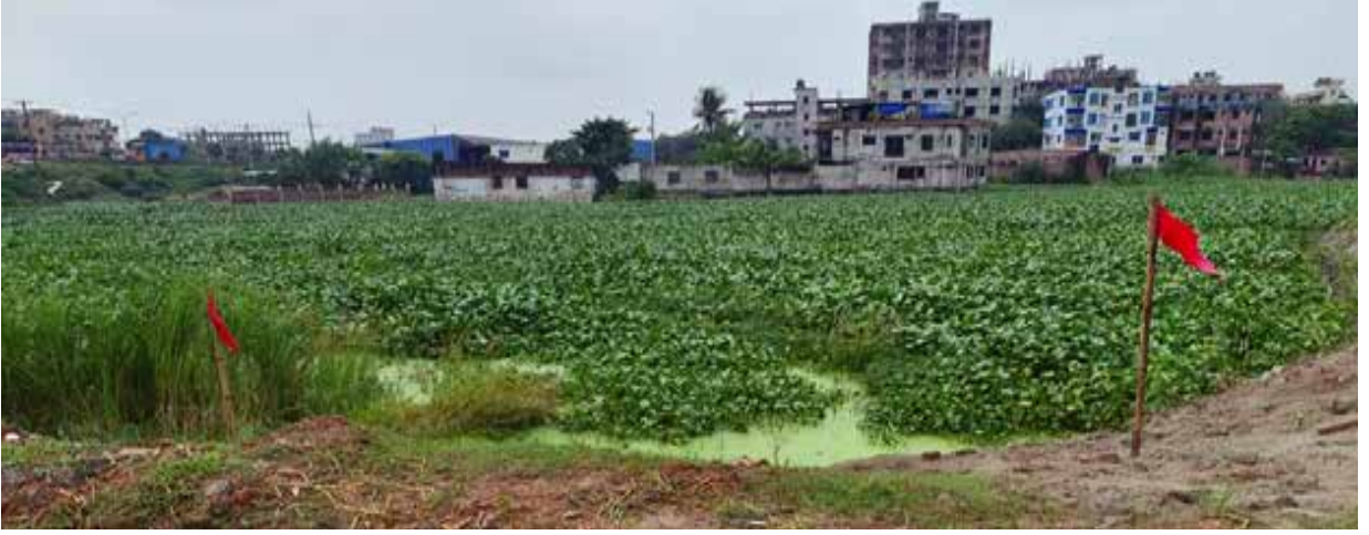
সাভার উপজেলাধীন বামনী খালের দখল ও ভরাট পরিদর্শন