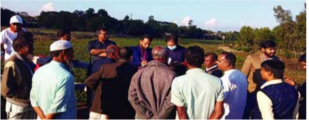
হবিগঞ্জ জেলাধীন এরাবরাক নদী পরিদর্শন ও কাগজপত্র পর্যালোচনা