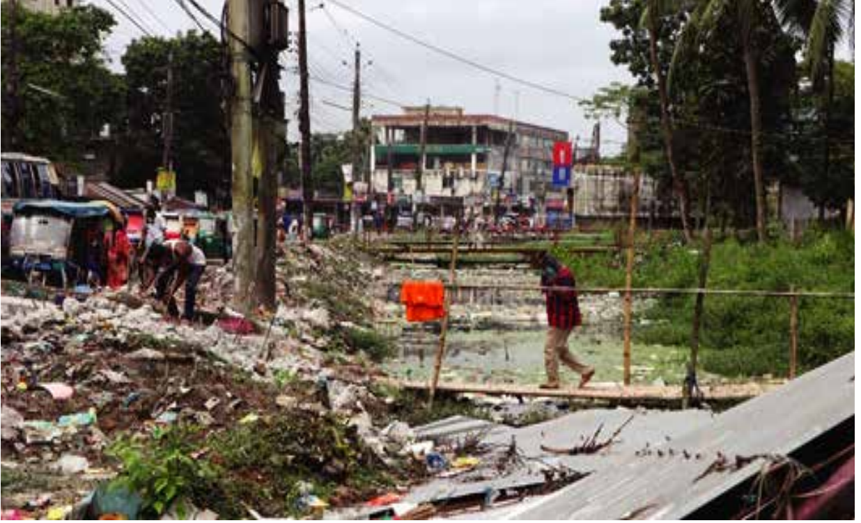
নোয়াখালী জেলাধীন সদর উপজেলার খালের দূষণ