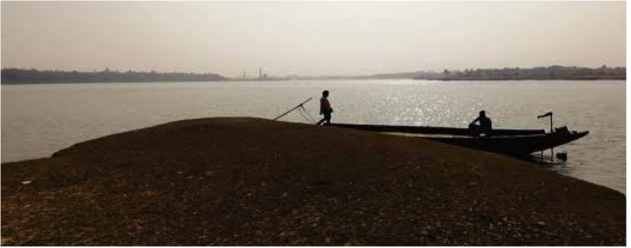
ভৈরব, আতাই ও রূপসা নদীর ত্রিমোহনা, খুলনা