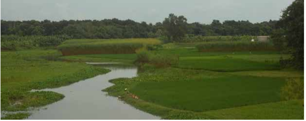
কুষ্টিয়া জেলাধীন মৃতপ্রায় কালীগঙ্গা নদী