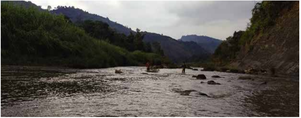
সাজু নদী, বান্দরবান