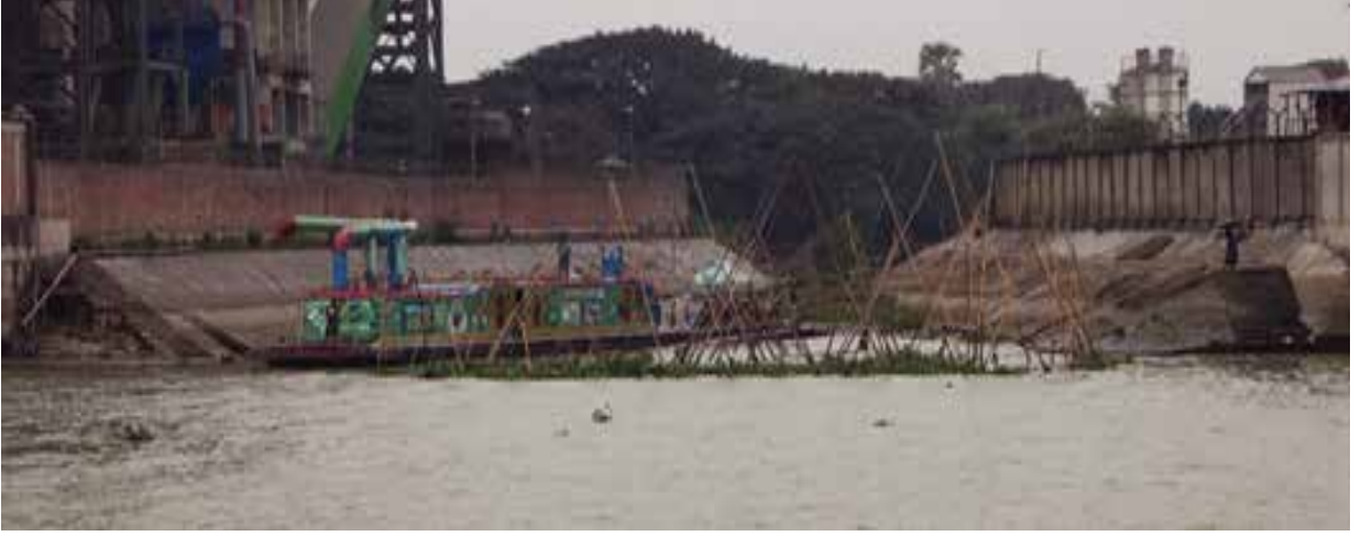
নারায়ণগঞ্জ জেলার মেঘনা নদীতে অবৈধভাবে বাঁধ নির্মাণের মাধ্যমে পানি প্রবাহে বাধা প্রদান