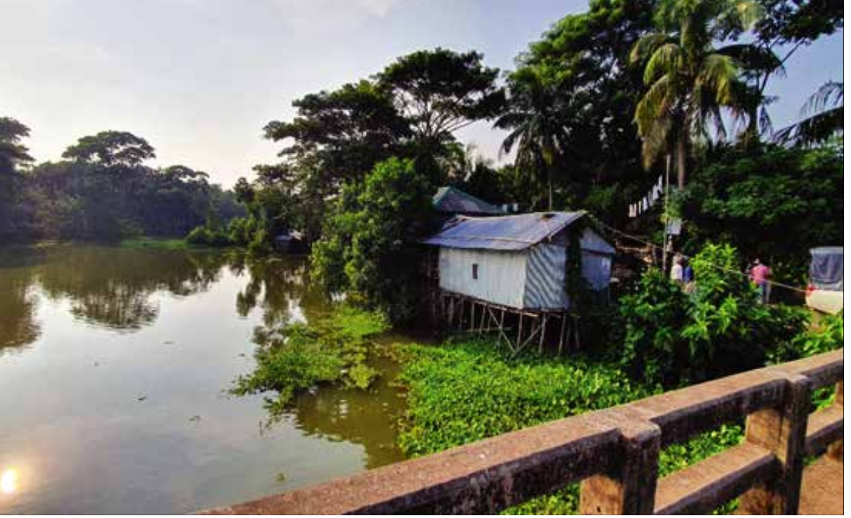
খুলনা জেলাধীন দাকোপ উপজেলার চড়া নদীর অবৈধ দখল