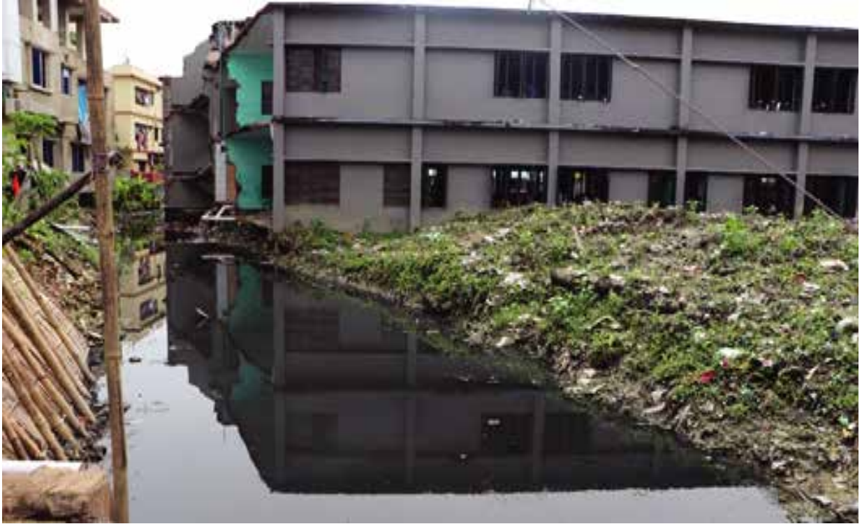
নোয়াখালী জেলাধীন সদর উপজেলার খালে অবৈধ দখল ও দূষণ