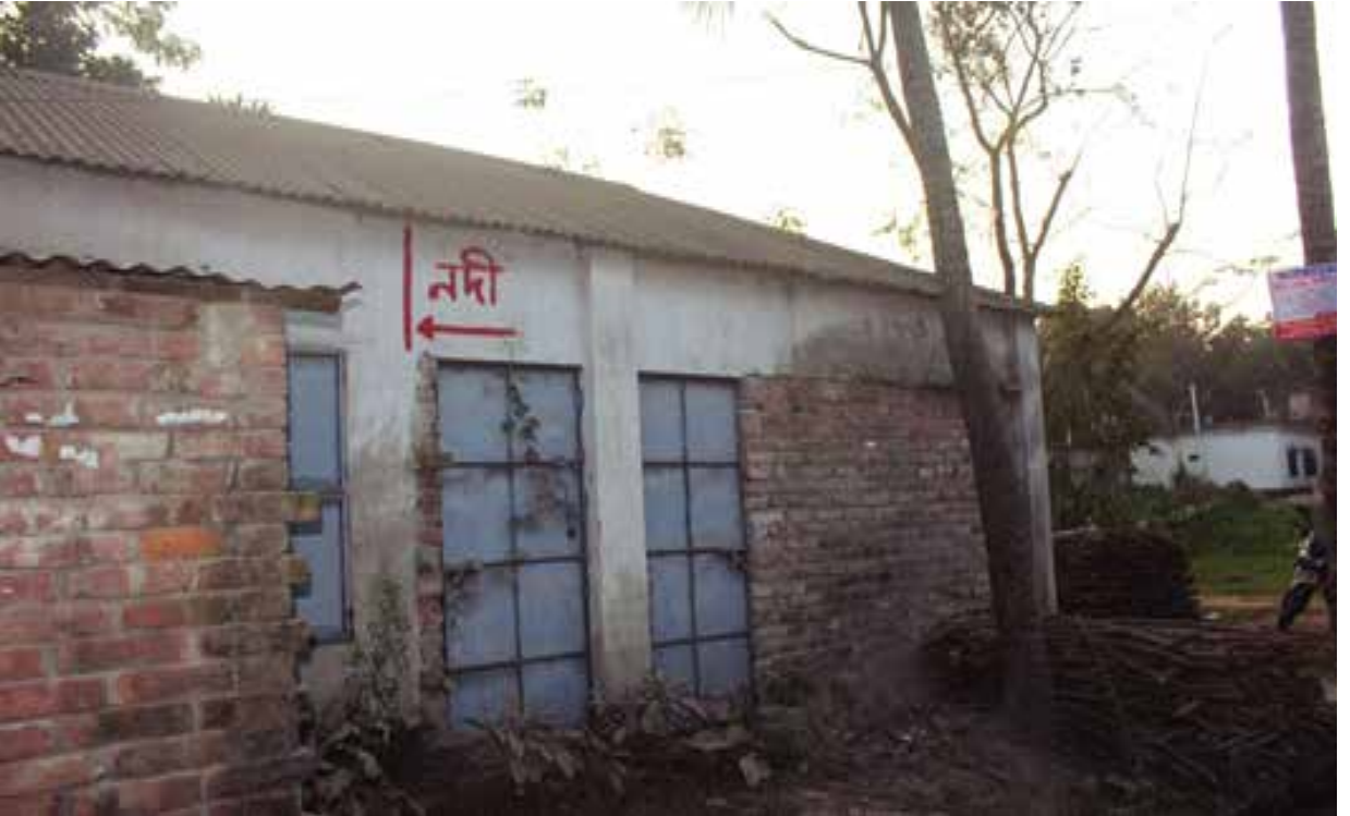
পাবনা জেলাধীন ইছামতি নদীর অবৈধ দখল