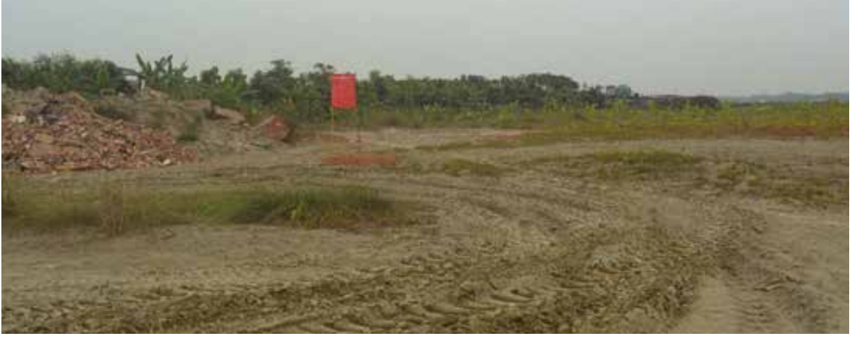
ত্রি এঙ্গেল মেরিন লিমিটেড কর্তৃক অবৈধভাবে দখলকৃত মুন্সিগঞ্জ জেলার গজারিয়া উপজেলার মেঘনা নদী, ফুলদি নদী ও সংলগ্ন খাল