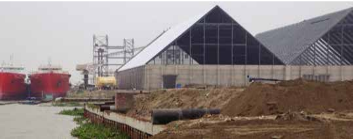
নারায়ণগঞ্জ জেলাধীন সোনারগাঁ উপজেলার মেঘনা নদীর অবৈধ দখল