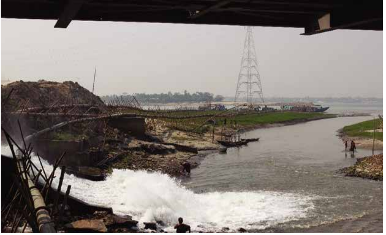
ব্রাহ্মণবাড়িয়া জেলাধীন আশুগঞ্জ উপজেলার আশুগঞ্জ পাওয়ার প্ল্যান্ট লি: কর্তৃক মেঘনা নদীর দূষণ