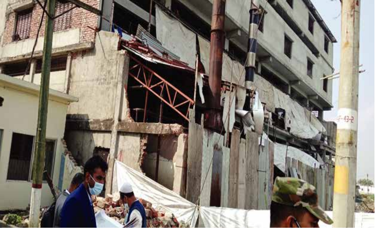
নরসিংদী জেলাধীন পুরাতন ব্রহ্মপুত্র নদের অবৈধ দখল উচ্ছেদ পরিদর্শন