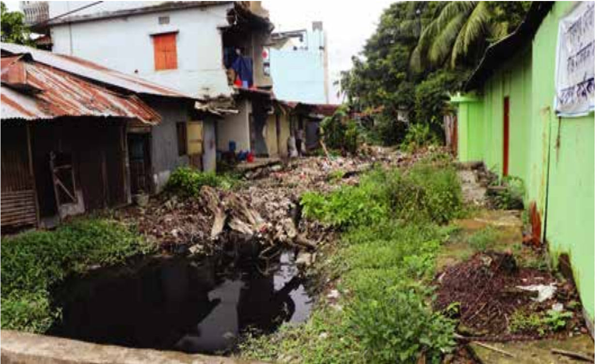
নোয়াখালী জেলাধীন সদর উপজেলার খালের দূষণ