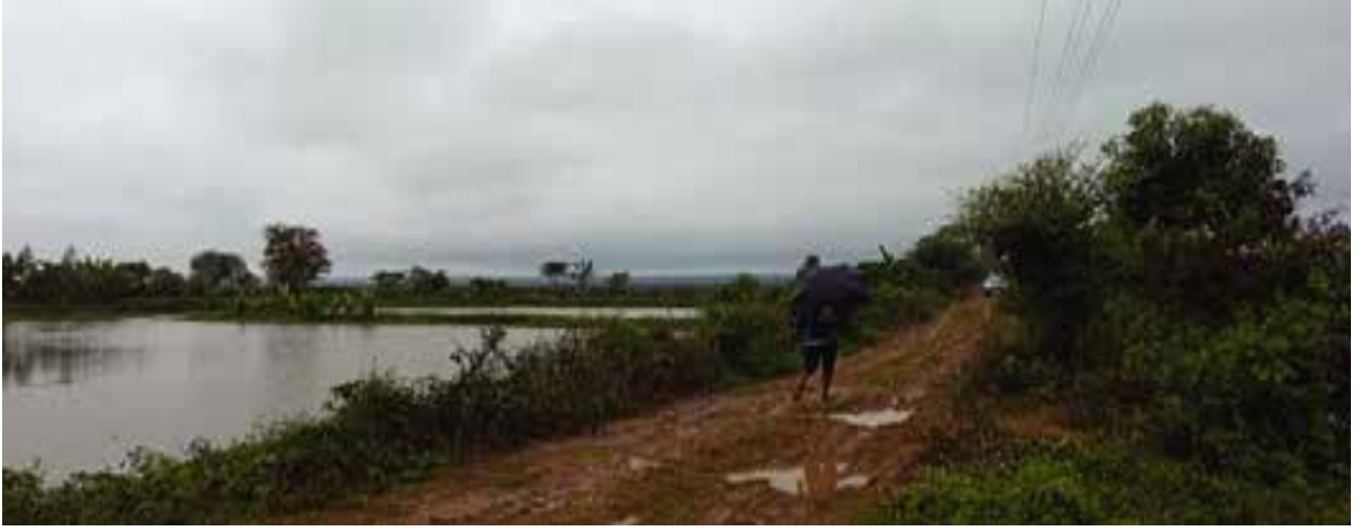
মৌলভীবাজার জেলাধীন হাইল হাওরের মাঝখানে রাস্তা