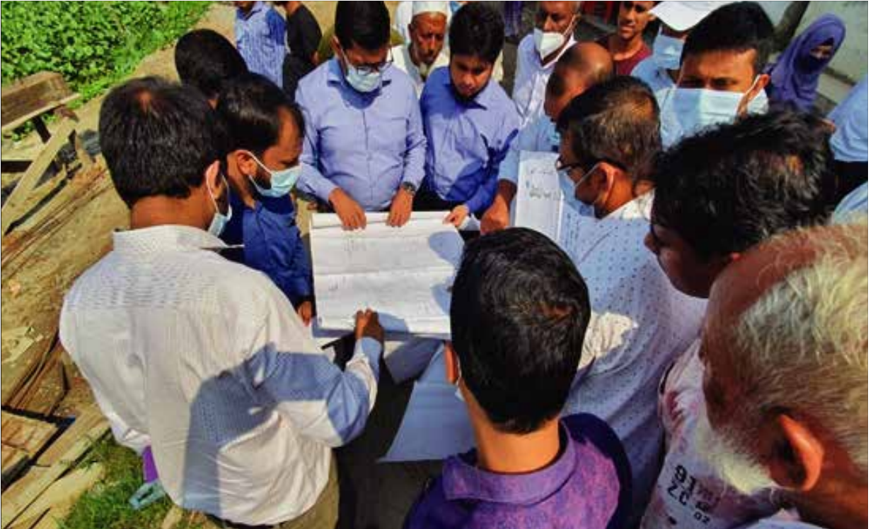
নোয়াখালী জেলার বেগমগঞ্জ উপজেলার ছয়ানি খালের অবৈধ দখল ও খালের উপর এলজিইডি কর্তৃক নির্মিয়মাণ ব্রিজ পরিদর্শন ও কাগজপত্র পর্যালোচনা