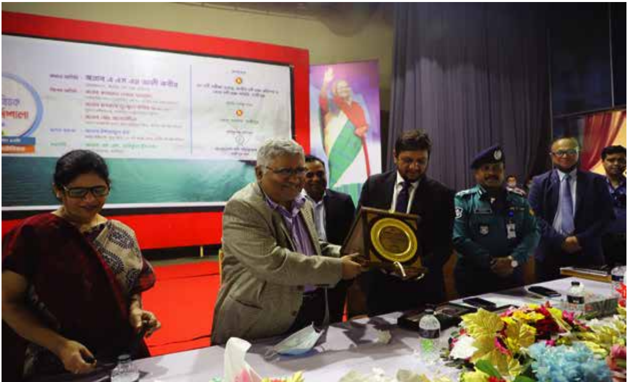
গাজীপুর জেলাধীন নদী সমীক্ষা বিষয়ক কর্মশালায় অংশগ্রহণ