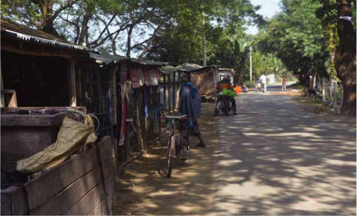
বিনাইদহ জেলাধীন কুমার নদের জায়গায় অবৈধ স্থাপনা