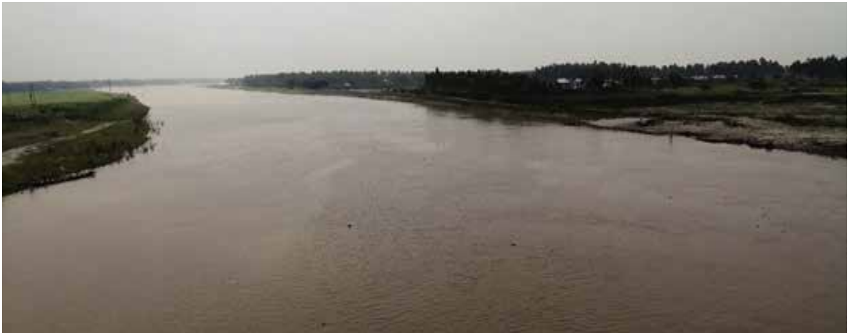
ধলেশ্বরী নদী, সাভার