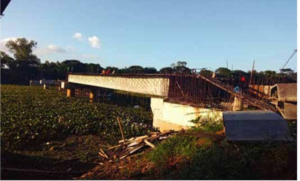
হবিগঞ্জ জেলাধীন এরাবরাক নদীর উপর এলজিইডি কর্তৃক স্বল্পদৈর্ঘ্য নির্মিতব্য ব্রিজ