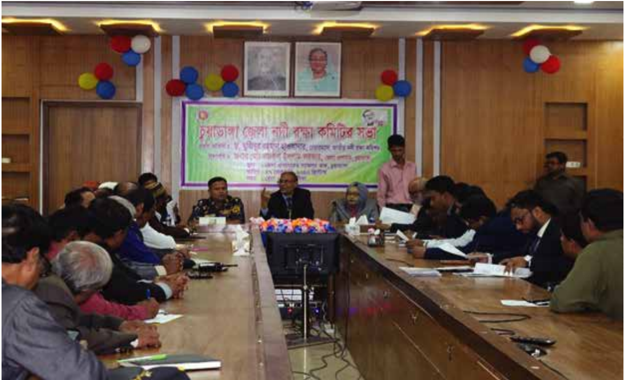
চুয়াডাঙ্গা জেলা নদী রক্ষা কমিটির সভায় যোগদান