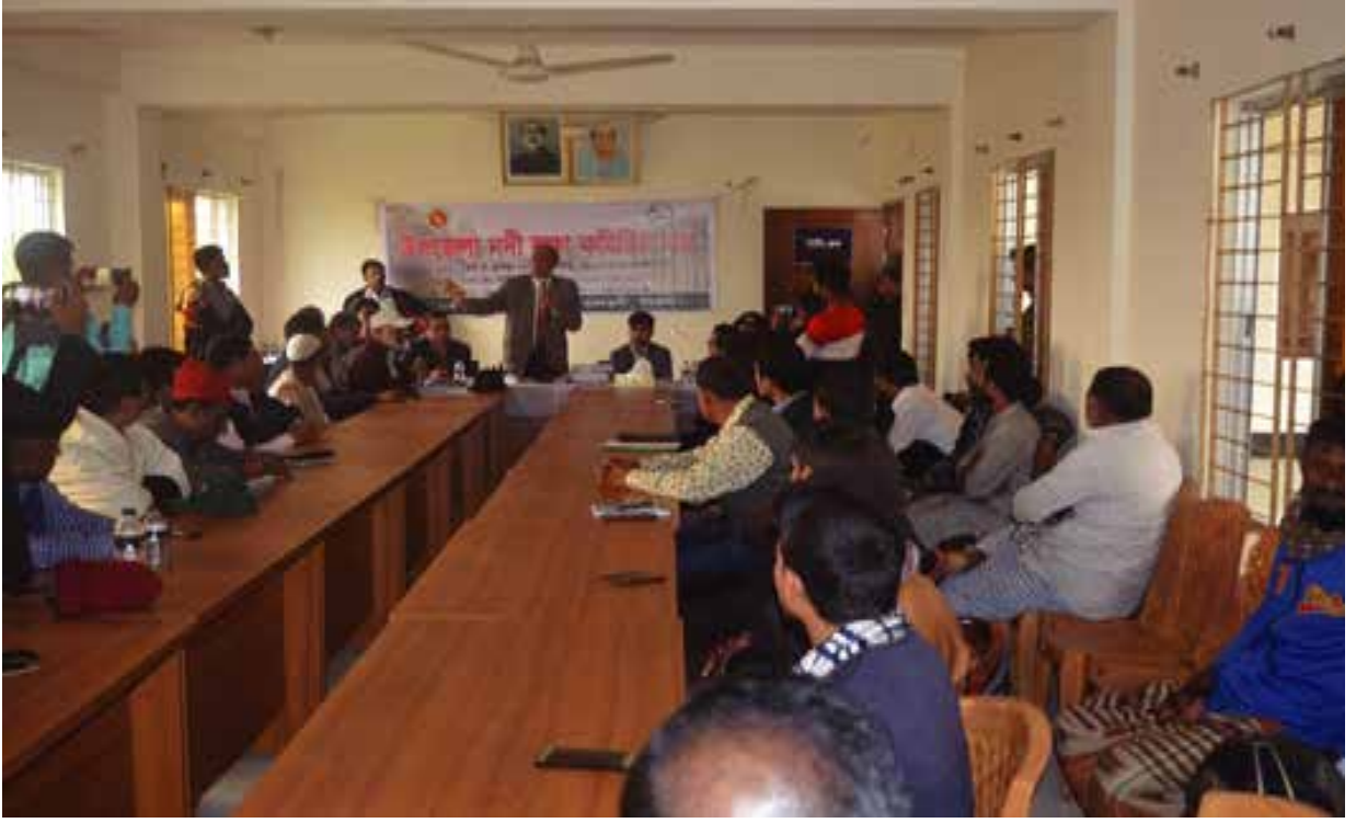
বরগুনা জেলাধীন তালতলী উপজেলার উপজেলা নদী রক্ষা কমিটির সভায় যোগদান