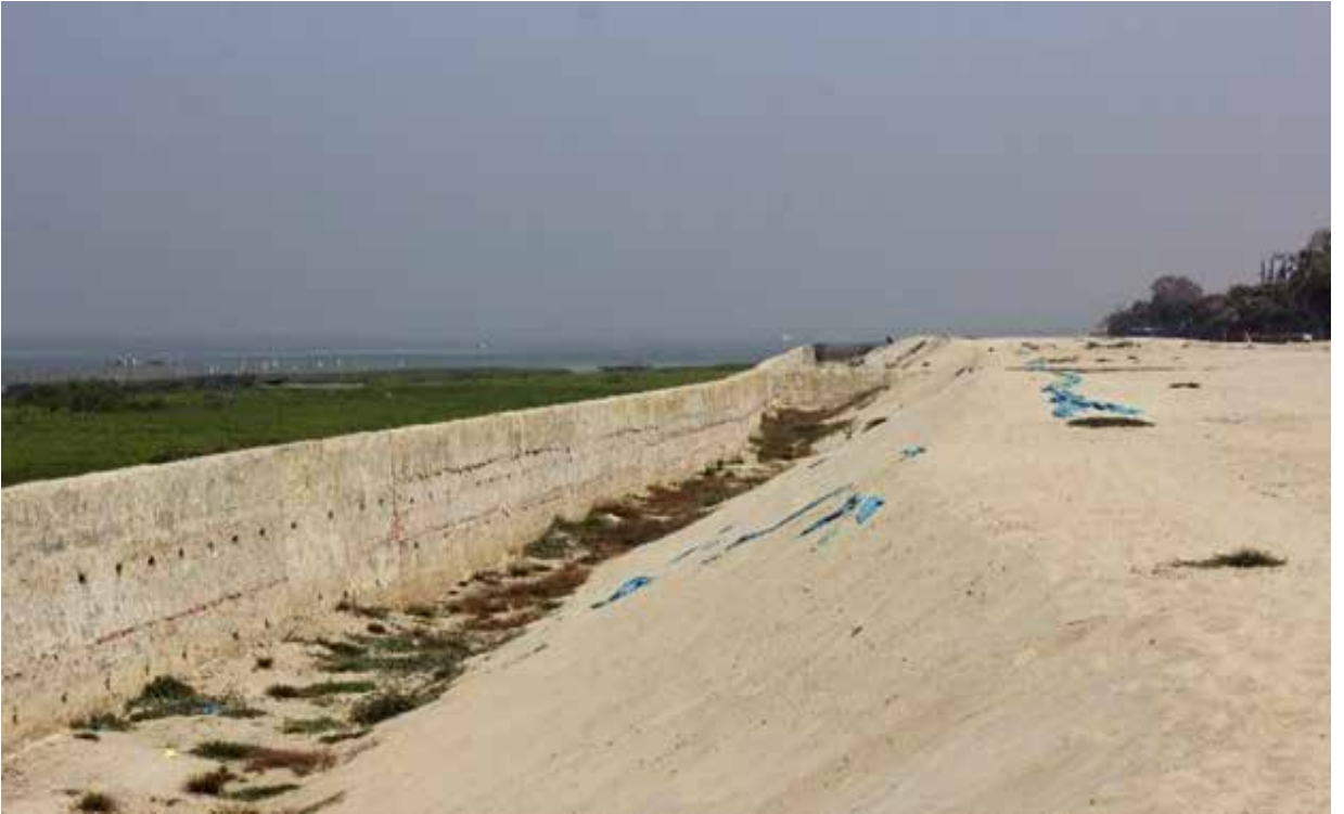
আশুগঞ্জ পাওয়ার প্লান্ট লি: কর্তৃক ব্রাহ্মণবাড়িয়া জেলাধীন আশুগঞ্জ উপজেলার মেঘনা নদী অবৈধভাবে ভরাটের স্থান