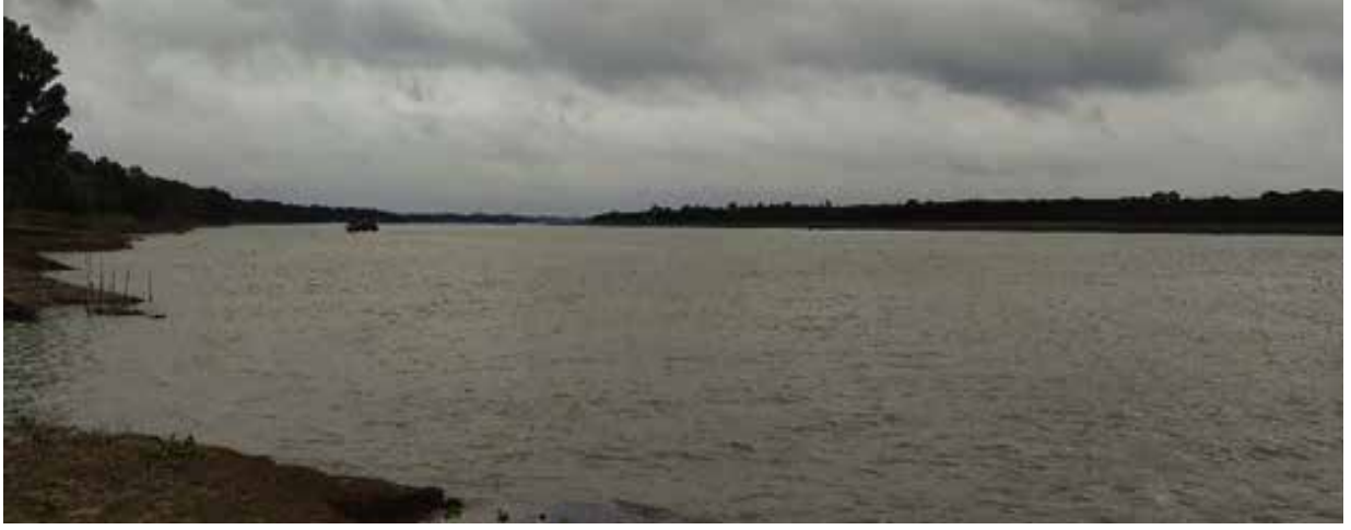
মহানন্দা নদী, চাঁপাইনবাবগঞ্জ