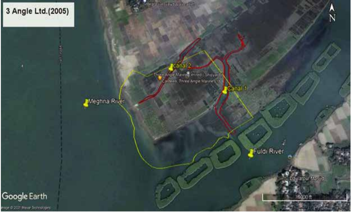
মুন্সিগঞ্জ জেলাধীন গজারিয়া উপজেলায় থ্রি অ্যাঙ্গেল মেরিন লিঃ কর্তৃক মেঘনা নদী, ফুলদি নদী ও সংলগ্ন খাল দখলের ২০০৫ সালের স্যাটেলাইট ইমেজ