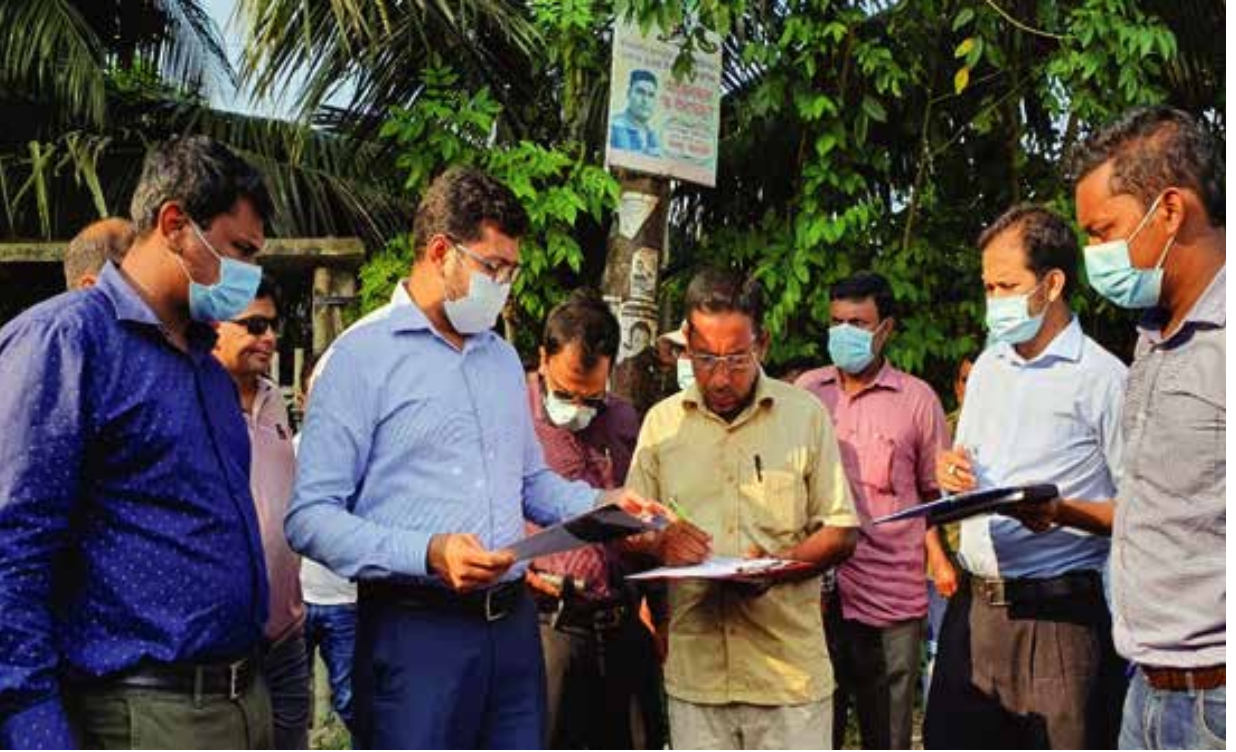
খুলনা জেলাধীন দাকোপ উপজেলার চড়া নদীর অবৈধ দখল পরিদর্শন ও কাগজপত্র পর্যালোচনা