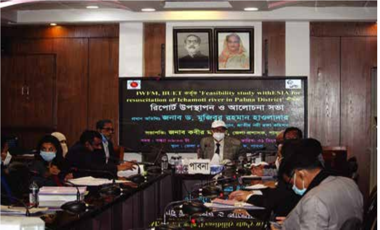
পাবনা জেলাধীন ইছামতি নদীর রিপোর্ট উপস্থাপন ও আলোচনা সভায় যোগদান