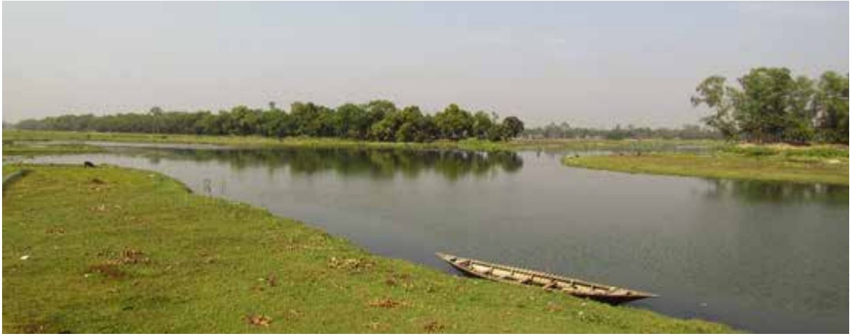
বুড়ি তিস্তা নদী, নীলফামারী