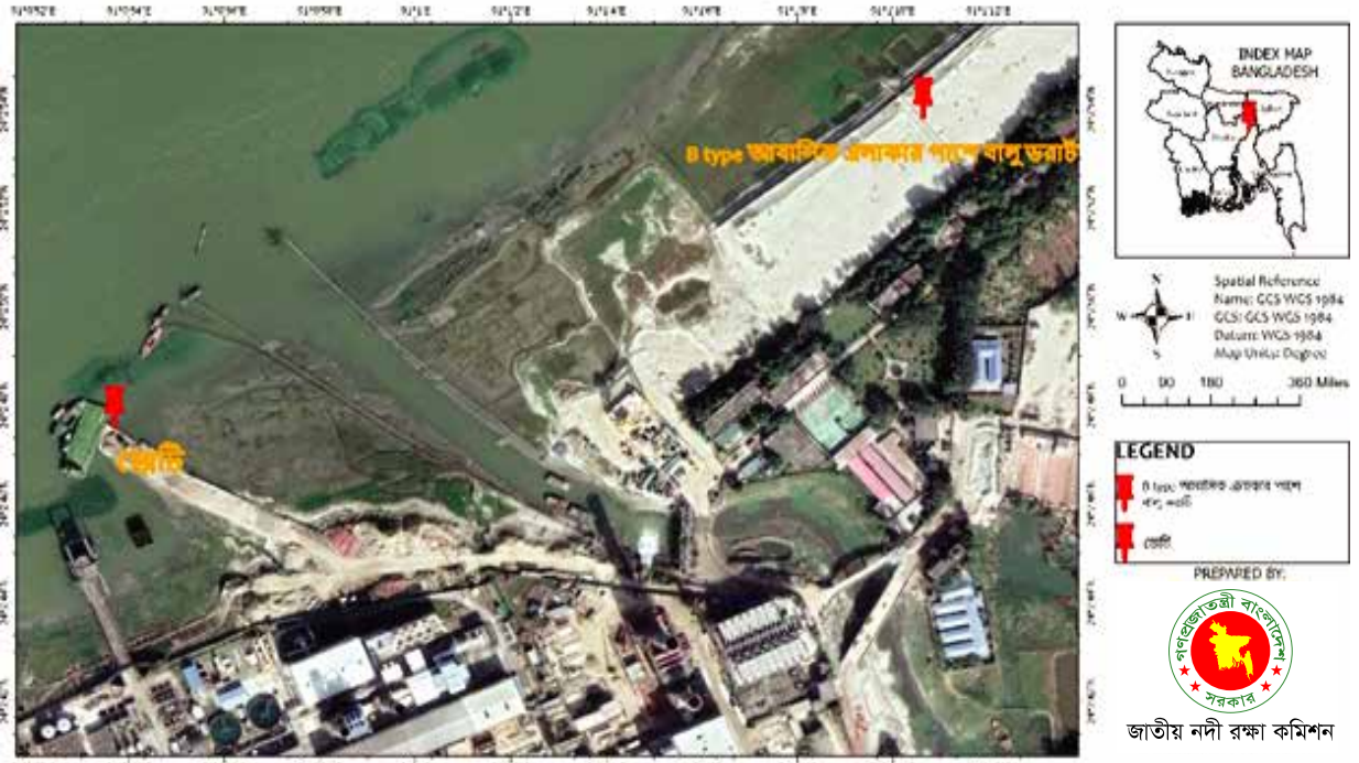
আশুগঞ্জ পাওয়ার প্ল্যান্ট লি: কর্তৃক ব্রাহ্মণবাড়িয়া জেলাধীন আশুগঞ্জ উপজেলার মেঘনা নদীর ২০২১ সালের স্যাটেলাইট ইমেজ