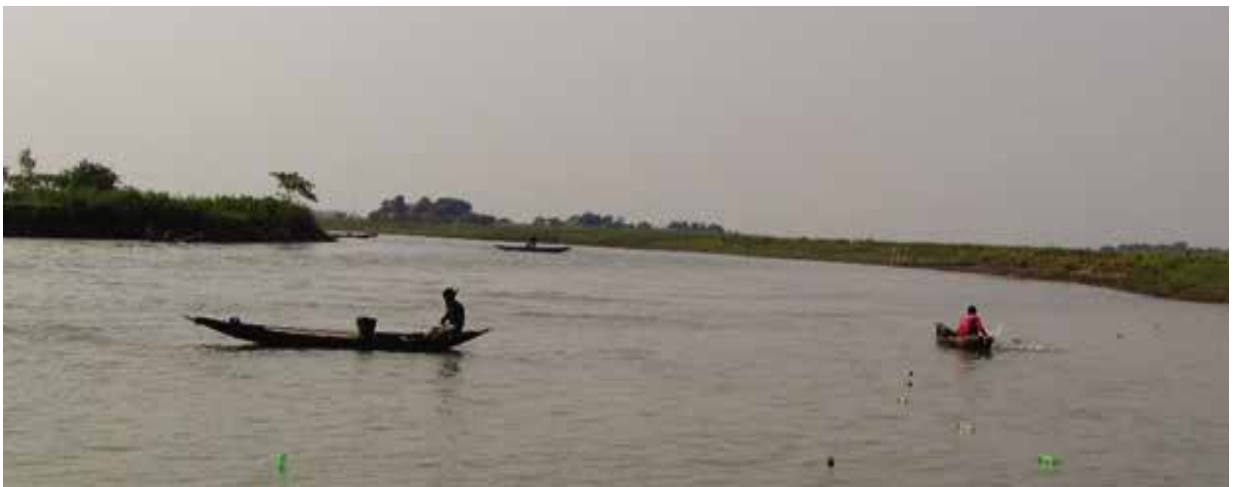
সুরমা নদী, সুনামগঞ্জ