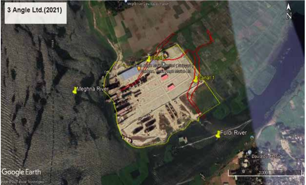
মুন্সিগঞ্জ জেলাধীন গজারিয়া উপজেলায় থ্রি অ্যাঙ্গেল মেরিন লিঃ কর্তৃক মেঘনা নদী, ফুলদি নদী ও সংলগ্ন খাল দখলের ২০২১ সালের স্যাটেলাইট ইমেজ