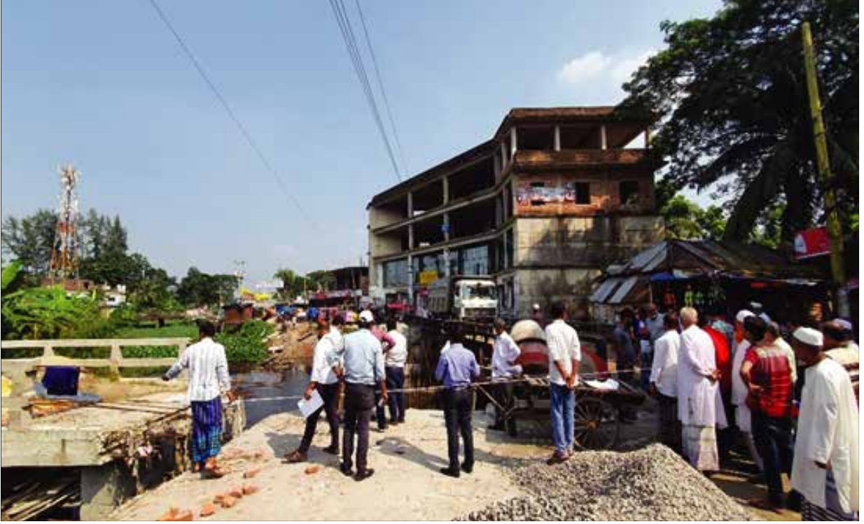
নোয়াখালী জেলার বেগমগঞ্জ উপজেলার ছয়ানি খালের অবৈধ দখল ও খালের উপর এলজিইডি কর্তৃক নির্মিয়মাণ ব্রিজ