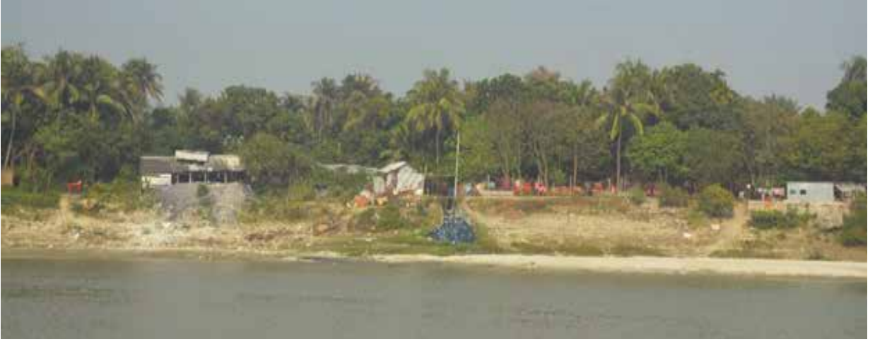
কুষ্টিয়া জেলাধীন গড়াই নদীর দূষণ