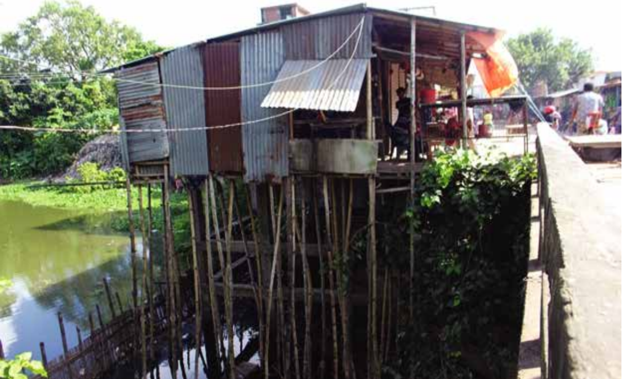
কুষ্টিয়া জেলাধীন ডাকুয়া নদীতে অবৈধ দখল