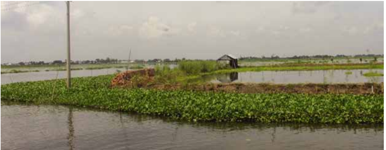
ব্রাহ্মণবাড়িয়া জেলাধীন বিজয়নগর উপজেলার বিল পরিদর্শন