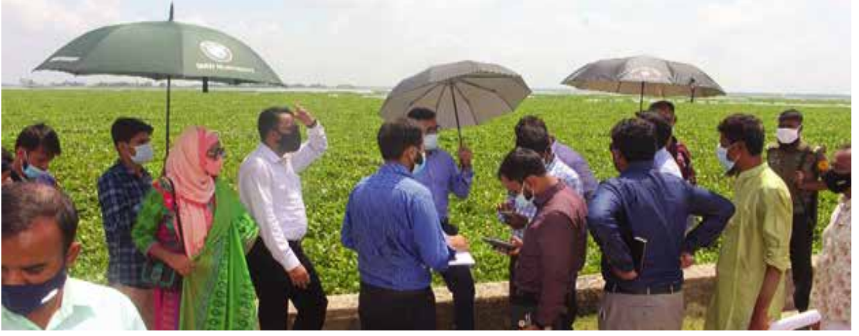
ব্রাহ্মণবাড়িয়া জেলাধীন বিজয়নগর উপজেলার বিল পরিদর্শন