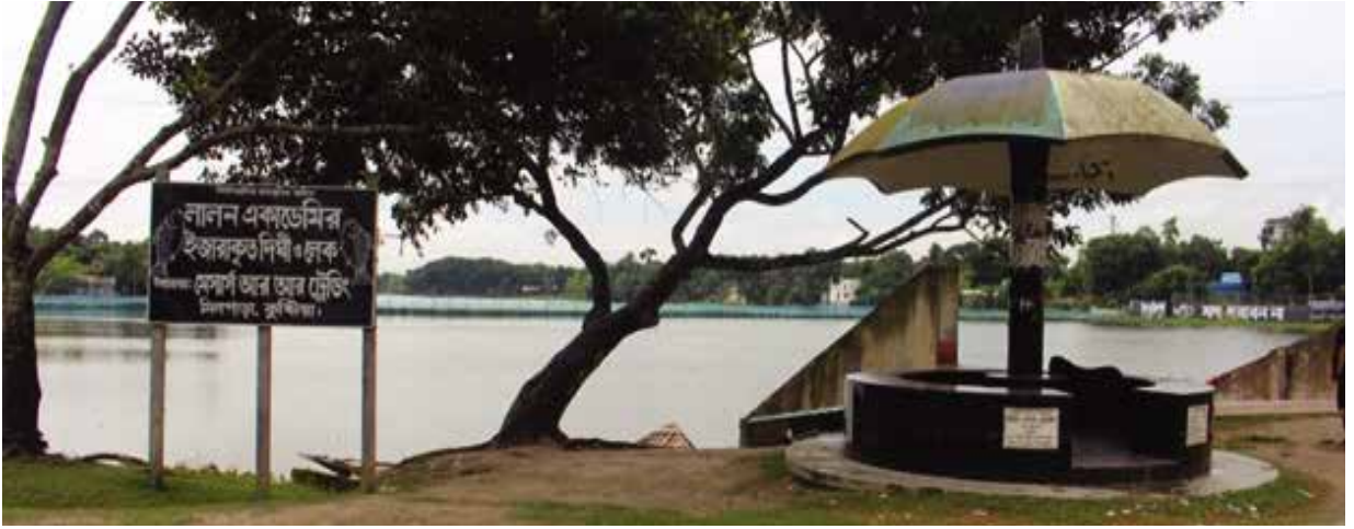
কুষ্টিয়া জেলাধীন কালীগঙ্গা নদীর জায়গা ইজারা প্রদান