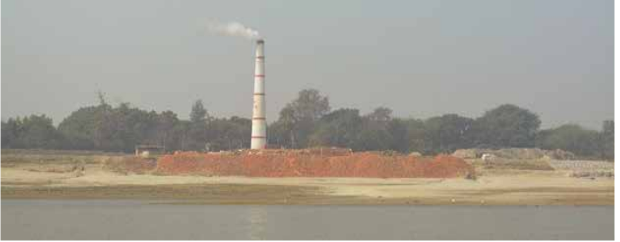
কুষ্টিয়া জেলাধীন গড়াই নদীর তীরে পরিবেশ অধিদপ্তরের ছাড়পত্র বিহীন ইটভাটা