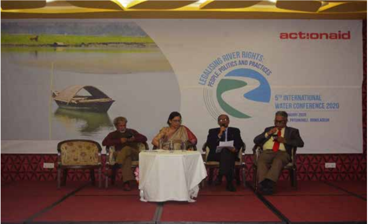
পটুয়াখালী জেলায় একশনএইড কর্তৃক আয়োজিত ৫ম আন্তর্জাতিক পানি সম্মেলনে যোগদান