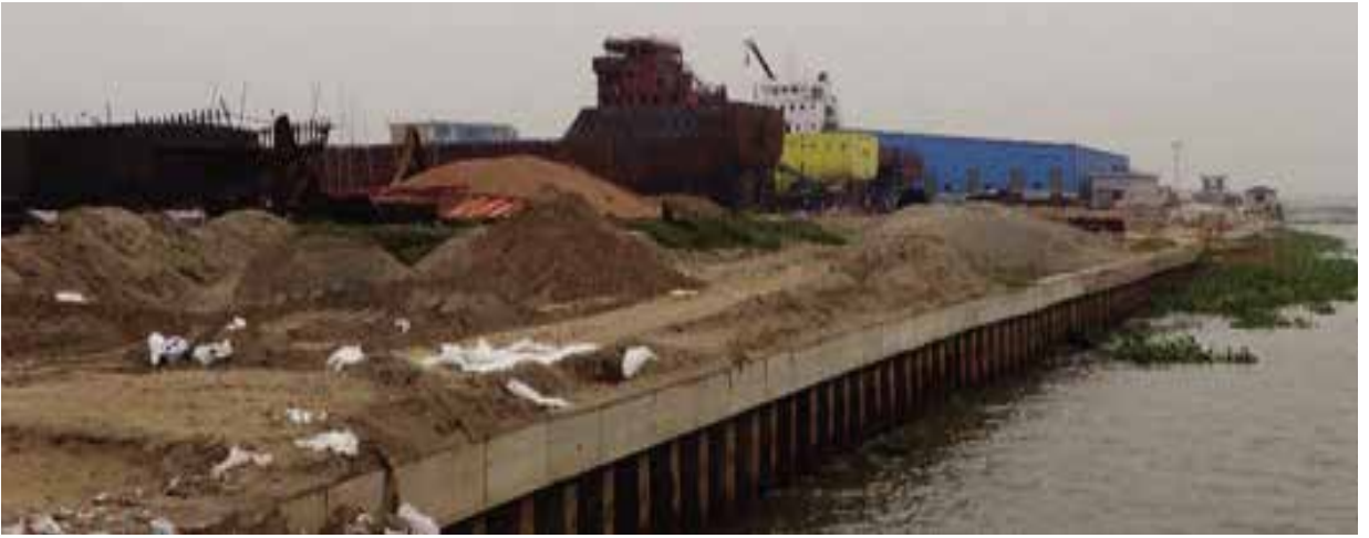
নারায়ণগঞ্জ জেলাধীন সোনারগাঁ উপজেলার মেঘনা নদীর অবৈধ দখল