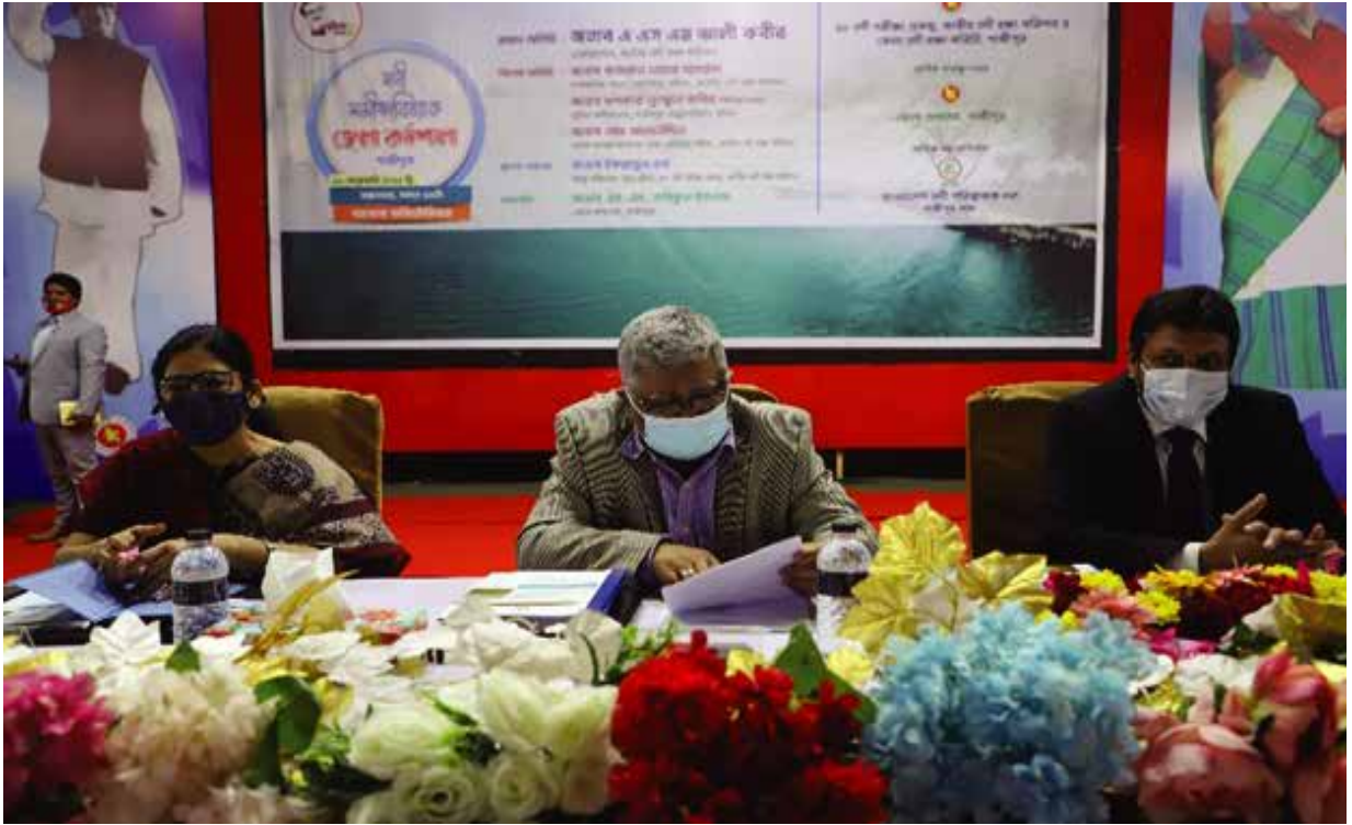
গাজীপুর জেলাধীন নদী সমীক্ষা বিষয়ক কর্মশালায় অংশগ্রহণ