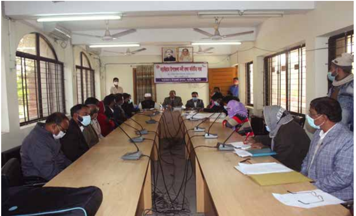
নাটোর জেলার বড়াইগ্রাম উপজেলা নদী রক্ষা কমিটির সভায় যোগদান