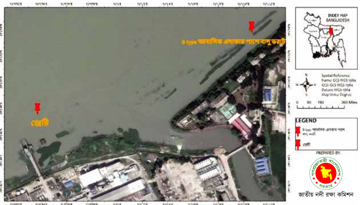
আশুগঞ্জ পাওয়ার প্ল্যান্ট লি: কর্তৃক ব্রাহ্মণবাড়িয়া জেলাধীন আশুগঞ্জ উপজেলার মেঘনা নদীর ২০১৮ সালের স্যাটেলাইট ইমেজ