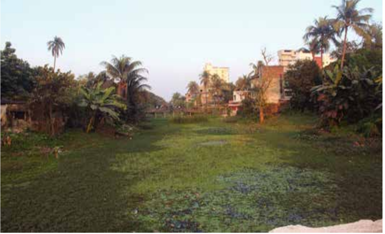
পাবনা জেলাধীন ইছামতি নদীর অবৈধ দখল