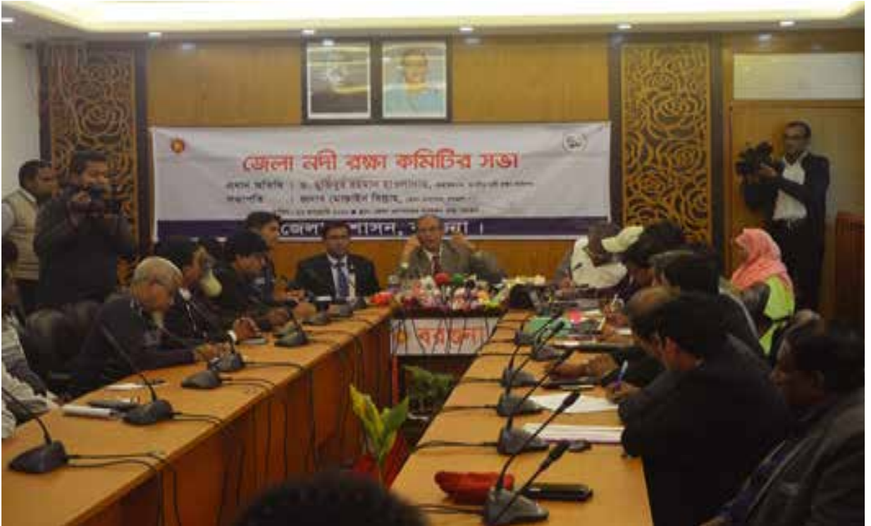
বরগুনা জেলা নদী রক্ষা কমিটির সভায় যোগদান