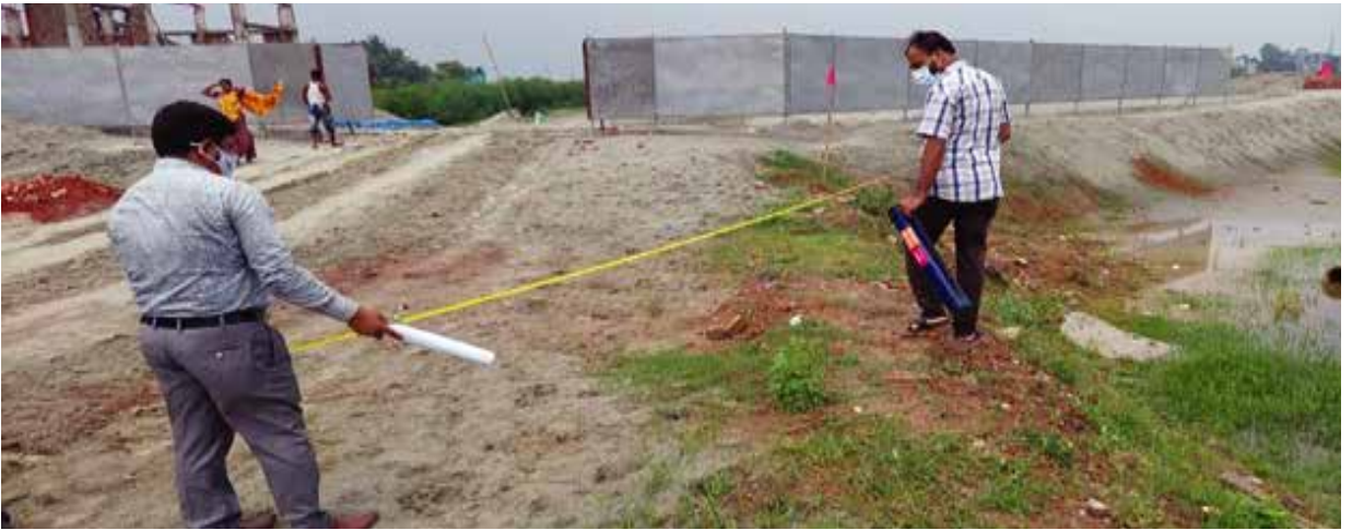
সাভার উপজেলাধীন বামনী খালের দখল ও ভরাট পরিদর্শন