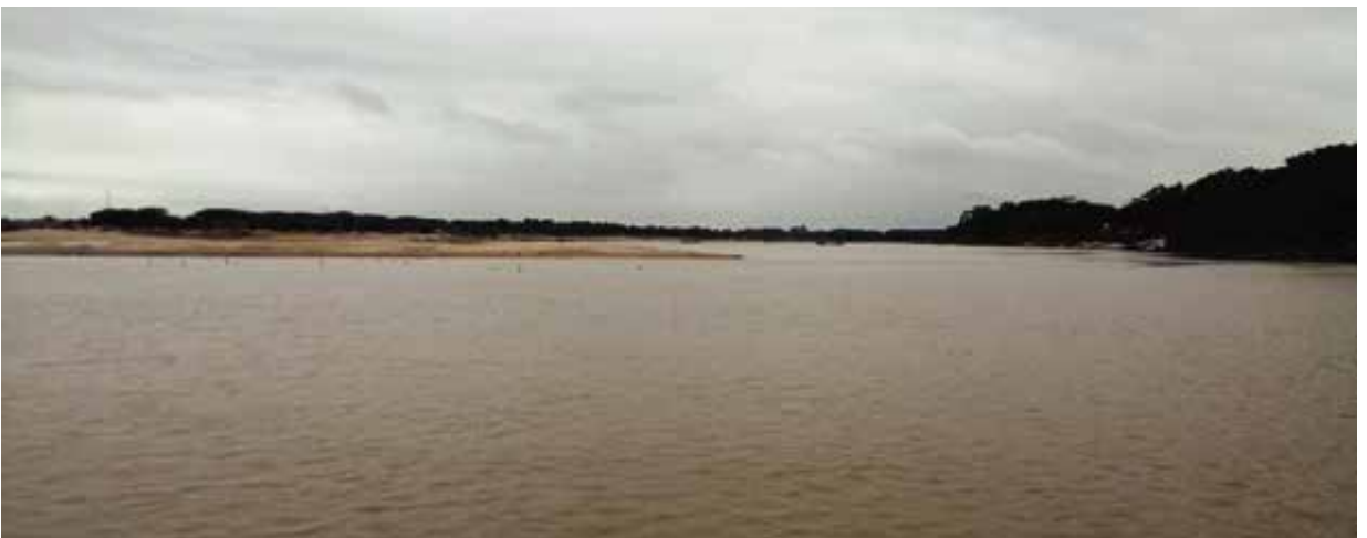
সোমেশ্বরী নদী, নেত্রকোণা