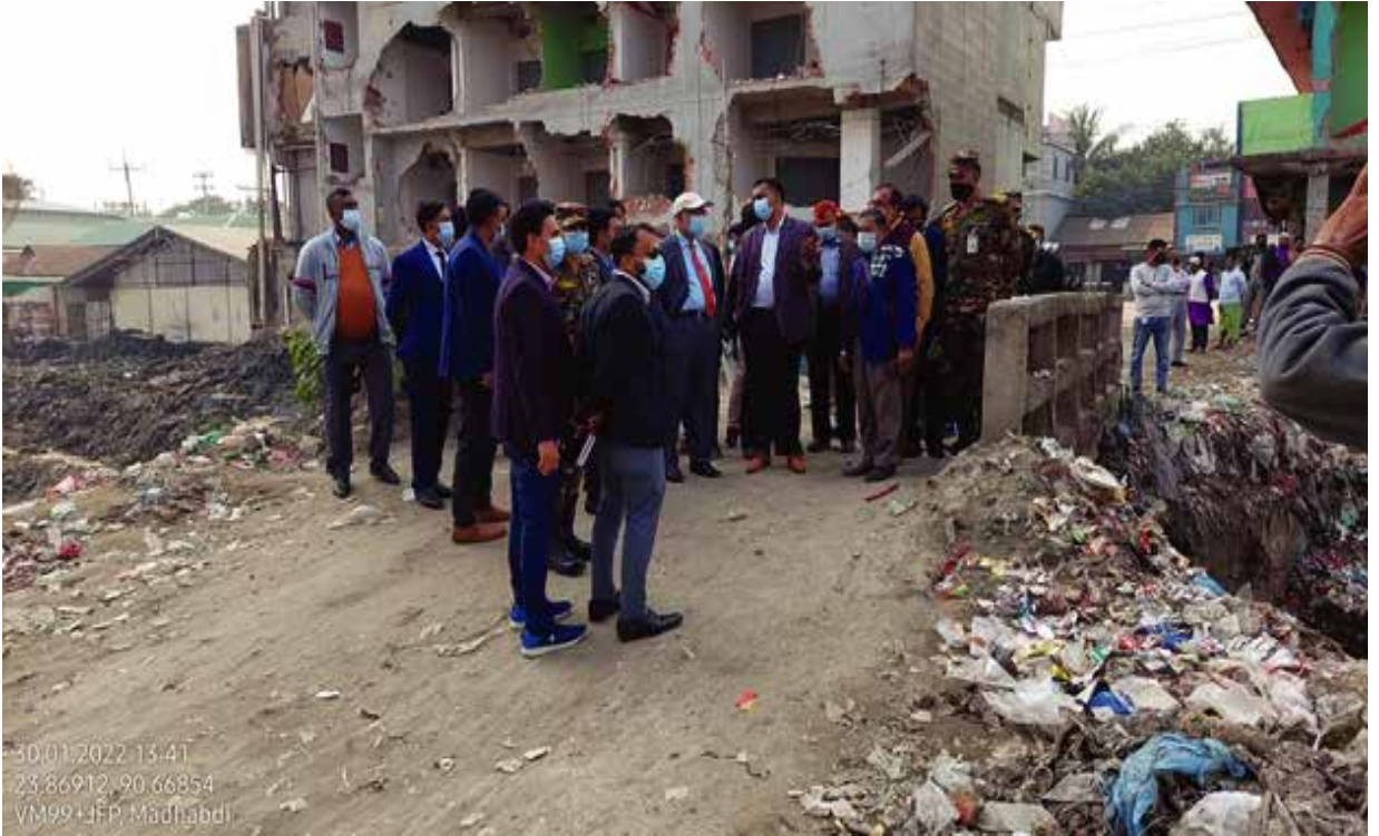
নরসিংদী জেলাধীন পুরাতন ব্রহ্মপুত্র নদের অবৈধ দখল উচ্ছেদ পরিদর্শন