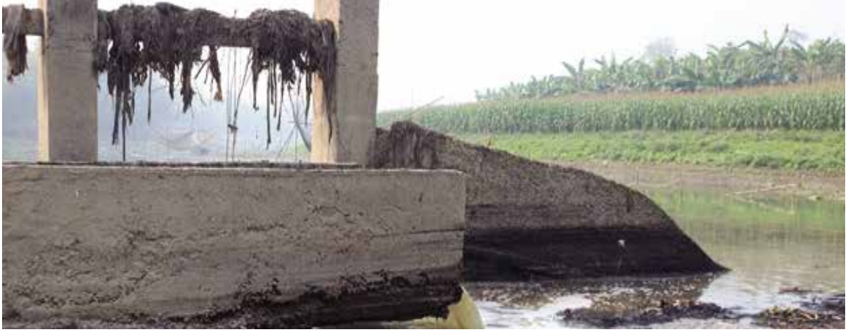
কেরফ এন্ড কোম্পানী কর্তৃক চুয়াডাঙ্গা জেলাধীন মাথাভাঙ্গা নদী দূষণ