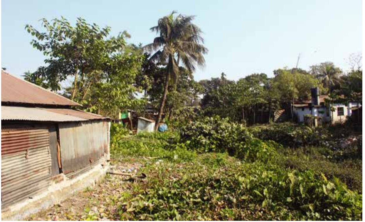
নাটোর জেলাধীন বড়াল নদীর অবৈধ দখল