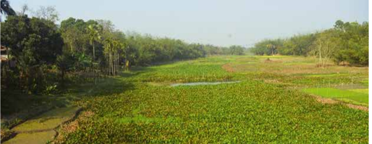
ঝিনাইদহ জেলাধীন কুমার নদের নাব্যতা হীনতা