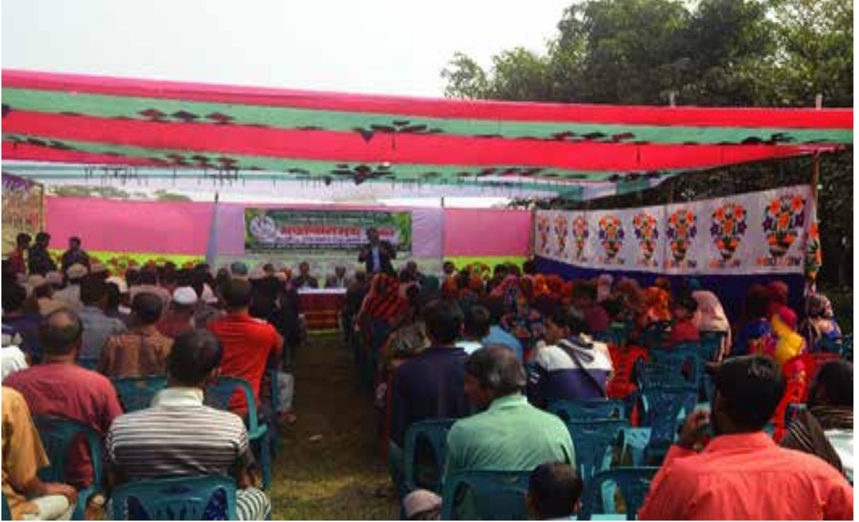
বরগুনা জেলাধীন তালতলী উপজেলার শুভসন্ধ্যা সমুদ্র সৈকত এবং বুড়িশ্বর নদী ও বিষখালী নদী সংশ্লিষ্ট জনগোষ্ঠীর সাথে মতবিনিময় সভা