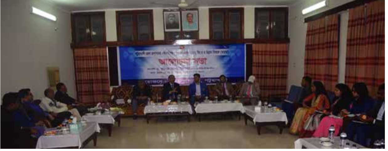
পটুয়াখালী জেলা প্রশাসনের কর্মকর্তা কর্মচারীদের সাথে নদ-নদীর উন্নয়নে আলোচনা