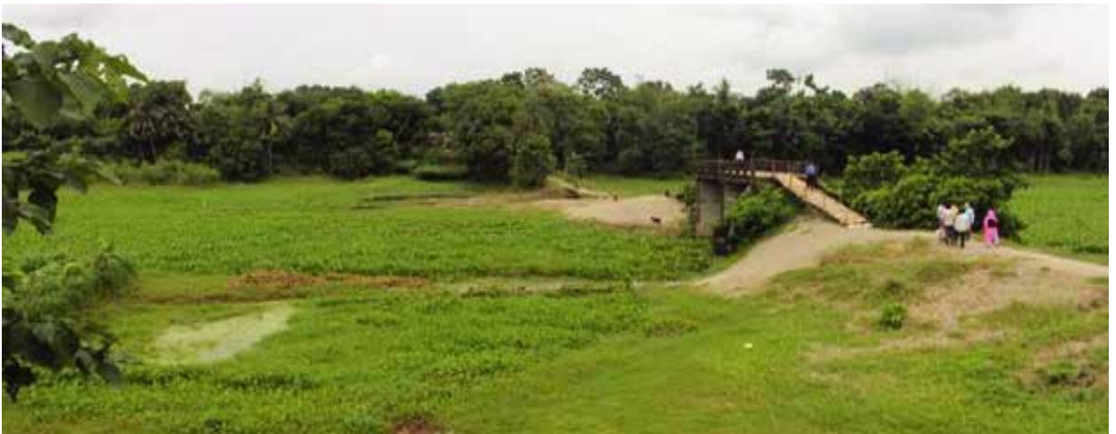
কুষ্টিয়া জেলাধীন কালীগঙ্গা নদীর উপর নির্মিতব্য স্বল্পদৈর্ঘ্য ব্রিজ